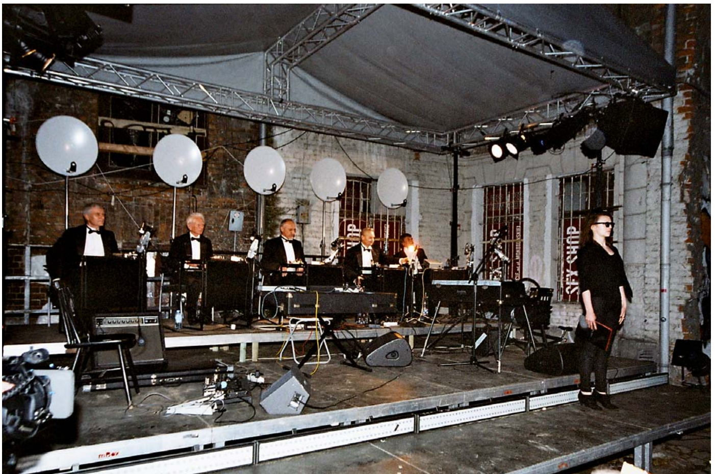
Info: SP5ELA