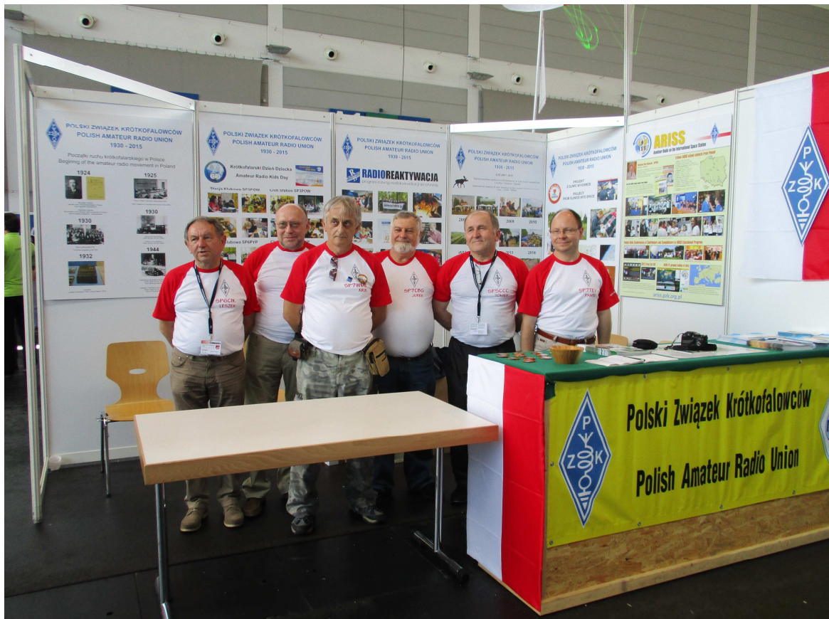
Obsada stanowiska PZK.