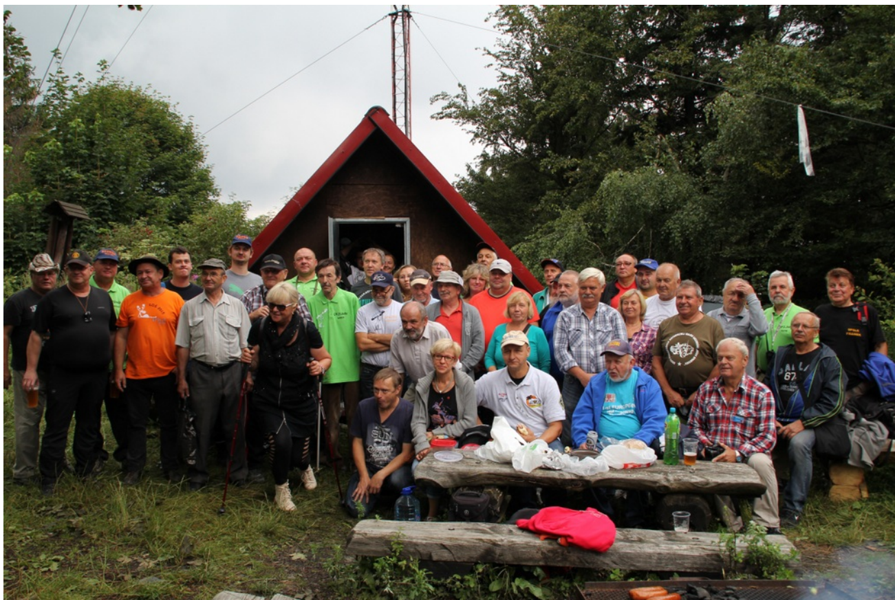
Uczestnicy tegorocznej edycji spotkań na Biskupiej Kopie.

Jak co roku w pierwszy pełny weekend sierpnia krótkofalowcy z Czech i Polski spotkali się na Biskupiej Kopie. W tym roku mimo zmiennej aury pogodowej na terenie koło