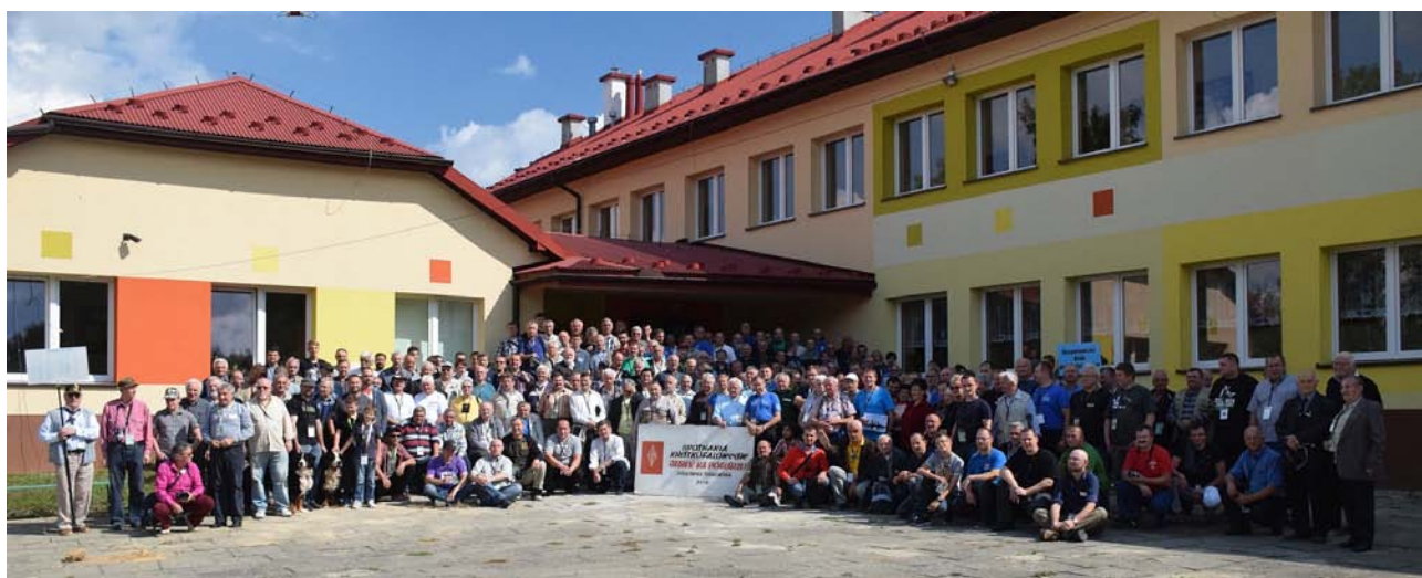
Uczestnicy spotkania „Krótkofalarska Jesień na Pogórze” - Jodłówka Tuchowska 2015 r.

Zarząd Oddziału Terenowego PZK nr 28 w Tarnowie, serdecznie zaprasza na XXXI już spotkanie w Jodłówce Tuchowskiej, pod hasłem „ Krótkofalarska Jesień na Pogórze ”, które organizowane jest dla podsumowania Zawodów Tarnowskich i wręczenia zwycięzcom trofeów. Spotkanie tradycyjnie odbywa się w drugi weekend września. W bieżącym roku będą to dni 9-11 września .