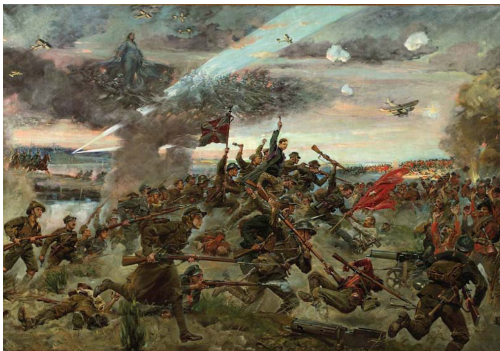
Jerzy Kossak, Cud nad Wisłą, Zamek Królewski w Warszawie

Bitwa Warszawska została uznana za 18 przełomową bitwę w historii świata. Zadecydowała o zachowaniu niepodległości przez Polskę i zatrzymała marsz rewolucji bolszewickiej na Europę Zachodnią.