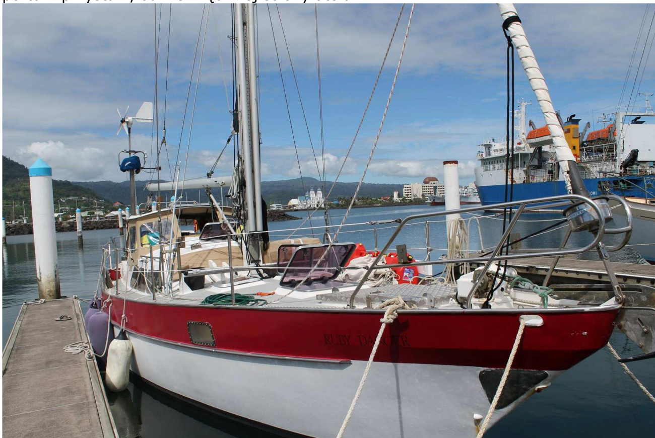
11 – metrowy jacht Ruby, którym z Apii na Kanton Island wyruszyła polska ekspedycja

Wg dzisiejszej wersji uzyskanych informacji chcą pozostać jeszcze tydzień. Po 4.5 dnia operacji radiowej T31T w logu jest 16.000 QSO. Ekspedycja T31T pracuje na CW, SSB i RTTY. Logi nie zostały załadowane do systemu ClubLog z powodu bardzo wolnego połączenia satelitarnego. Zostaną załadowane po powrocie zespołu ekspedycyjnego do Apii na Samoa. Na atolu – wyspie Kanton Island obozowisko T31T znajduje się blisko portu – przystani, od wewnętrznej strony atolu.