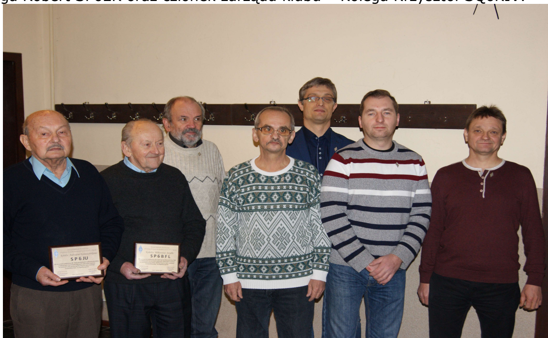
Na zdjęciu od lewej: SP6JU, SP6BFL, SP6DIL, SP6LUP, SP6OJE, SQ6DXP, SQ6DXZ.

Opole, 3 grudnia 2016 r. Opracował: Krzysztof SP6DVP-3Z6V