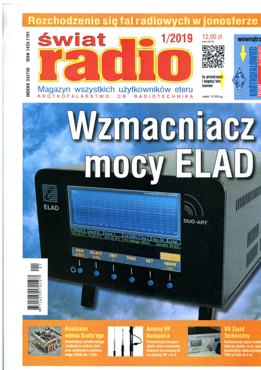
Świat Radio 1/2019 – okładka.

HOBBY: Analizator widma Scotty'ego DIGEST: Przegląd radiostacji amatorskich FORUM CZYTELNIKÓW: Porady RYNEK I GIEŁDA Spis treści rocznika 2018