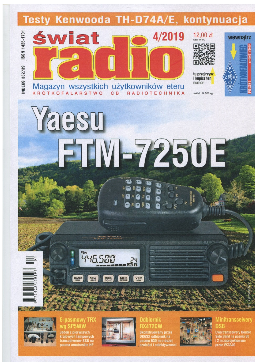
Okładka Świata Radio nr 4/3019

HOBBY: Radiodbiorniki AM, Minitransceivery DSB wg VK3AJG, Konstrukcje SP8TJK, Odbiornik RX472CW wg DK6SX RETRO: Pięciopasmowy transceiver wg SP5WW DIGEST: Konstrukcje antenowe VHF FORUM CZYTELNIKÓW: Porady, Listy RYNEK I GIEŁDA