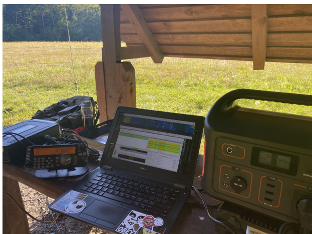
Wyposażenie stacji portabilno-mobilowej – „Kampinos” sierpień 2020.