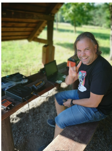
Ważne, że operatorowi dopisywał humor!