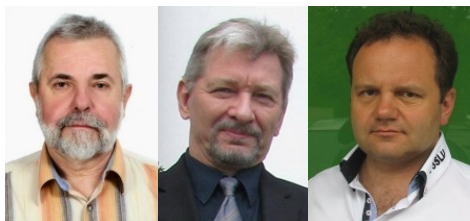
Redakcja Komunikatów PZK:

Komunikaty PZK są nadawane w każdą środę o godzinie 18:00 czasu lokalnego na częstotliwości 3702,5 KHz +/- QRM., a materiał w nich zawarty jest wykorzystywany przez Redakcję Krótkofalowca Polskiego.