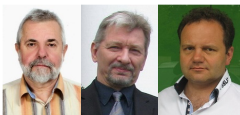
Redakcja Komunikatów PZK:

Komunikaty PZK są nadawane w każdą środę o godzinie 18:00 czasu lokalnego na częstotliwości 3702,5 KHz +/- QRM., a materiał w nich zawarty jest wykorzystywany przez Redakcję Krótkofalowca Polskiego.