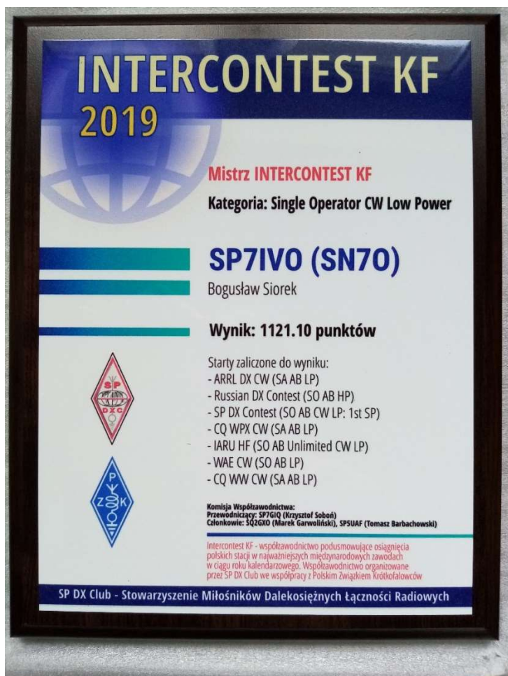
Certyfikat nagrody w Intercontest 2019