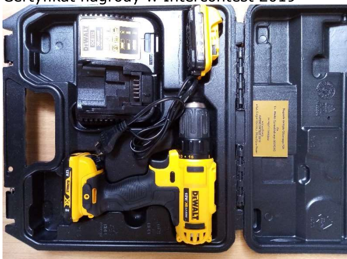
Nagroda za I. miejsce w poszczególnych klasyfikacjach.