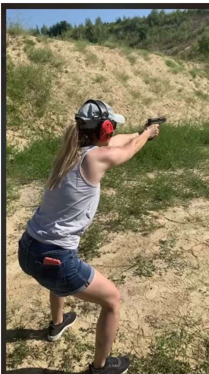
Ladies first (panie pierwsze). Daria SP5-73-008 z OT73 w akcji.