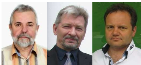
Redakcja Komunikatów PZK:

częstotliwości 3702,5 KHz +/- QRM, a materiał w nich zawarty jest wykorzystywany przez Redakcję Krótkofalowca Polskiego.