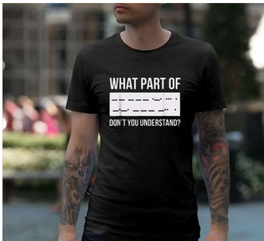
Napis na koszulce „Jakiej części kodu Morse’a nie rozumiesz?”