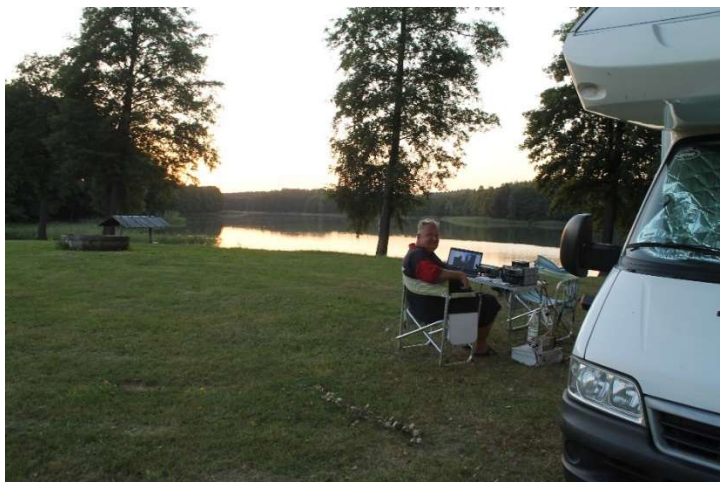
SP7VC/4, Przytuły KO04WD