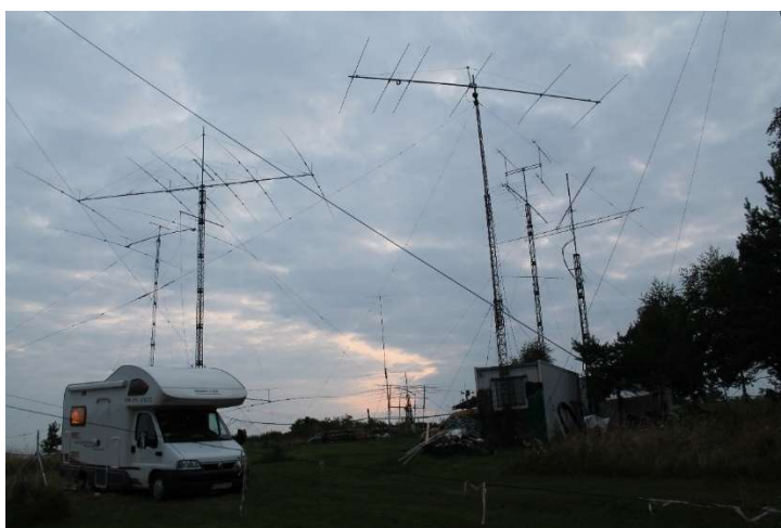
Odwiedziny na stacji contestowej w Chęcinach KO00FT