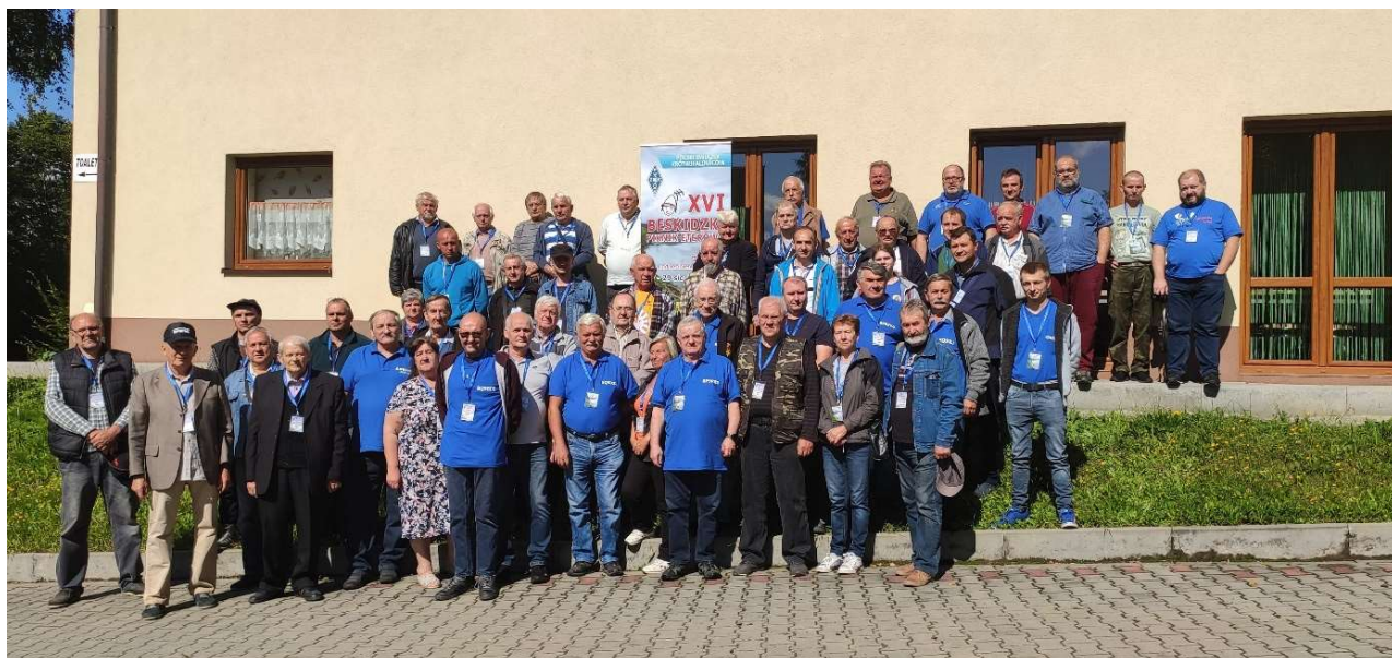
Zdjęcie grupowe uczestników XVI Beskidzkiego pikniku Eterowego

W imieniu organizatorów serdecznie zapraszamy za rok.