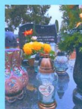
Stanisław Czerniewski SP2FMM 2019