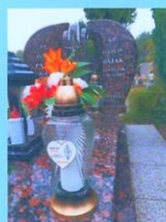
Czesław Pająk SP2VP 2015