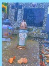
Leon Rychel SP2DOO 1995