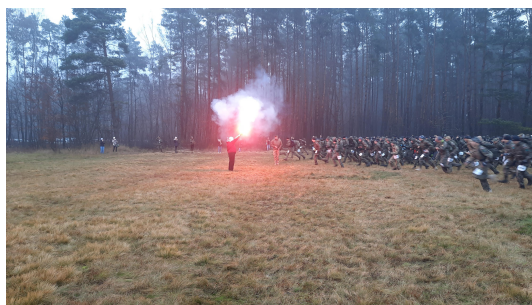
Start uczestników Maratonu Komandosa