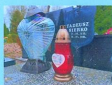
Tadeusz Sierko SP2JEG 2006