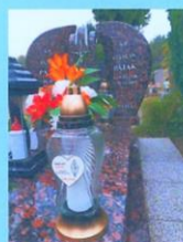
Czesław Pająk SP2VP 2015