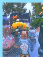
Stanisław Czerniewski SP2FMM 2019