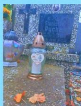
Leon Rychel SP2DOO 1995