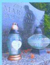
Zdzisław Marciniak SP2BSX 2001