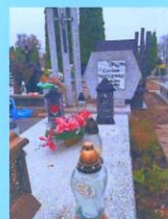
Czesław Mackiewicz SP2FWU 2015