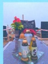
Zbigniew Gołębiwski SP2QCS 2021