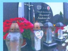
Ryszard Siekierski SP2FAV 2020